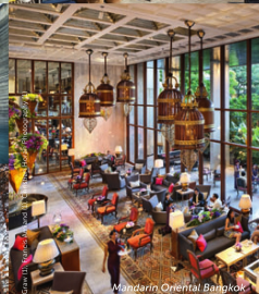
Mandarin Oriental Bangkok