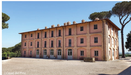
I Casali del Pino

Ich bin ein großer Fan von Baumhotels. Zu den schönsten zählt das TREEHOTEL in Schwedisch Lappland. Die sieben Zimmer schweben wie Vogelnester in luftiger Höhe, allerdings ist jedes davon ein Designobjekt, dabei super-komfortabel und absolut umweltfreundlich gebaut. treehotel.se