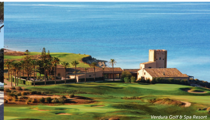
Verdura Golf & Spa Resort